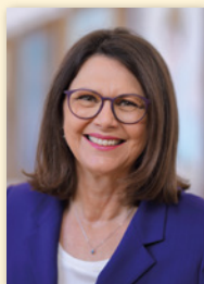
Ilse Aigner Präsidentin des Bayerischen Landtags